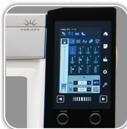
Pantalla táctil LCD en color de 5" de alta definición