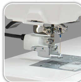
Compatible con A.S.R. (regulador de precisión de puntada) - Opcional