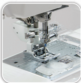
Sistema desmontable de alimentación de tejido en capas AcuFeed™ Flex